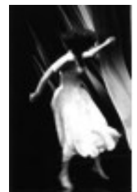
On ne badine pas avec l'amour

Tenter d'être dans une philosophie de l'exercice pour rester en mouvement et partager avec le public cette vibration, celle de la créativité de l'erreur.