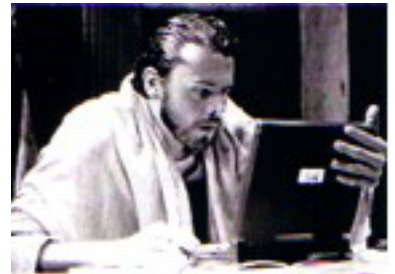
Exterminez toutes ces brutes

Et une composition à partir de l'essai de Sven Lindqvist Exterminez toutes ces brutes , l'odyssée d'un homme au cœur des ténèbres et les origines du génocide européen. Cette adaptation théâtrale, réalisée par Laëtitia Pitz a été cooptée par le Stadtsteater de Stockholm.